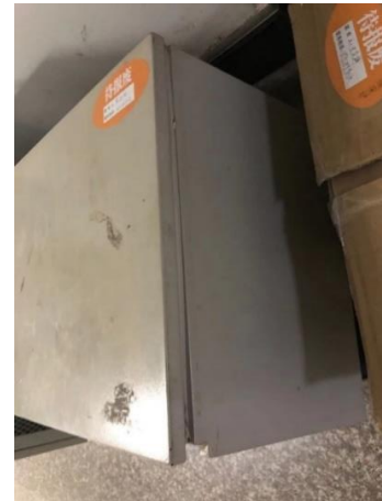
生科楼 C7014—待报废的仪器仍然在使用，负责人盛下放