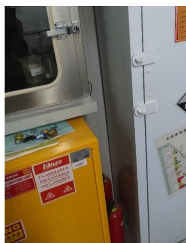
逸夫楼 5010—危化品柜钥匙随意放在桌上，未双人双锁管理， 负责人杨倩（左图为初查，右图为复查）