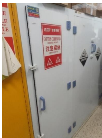
逸夫楼 2018—危化品柜放普通试剂且未双人双锁管理， 负责人江善祥（左图为初查，右图为复查）